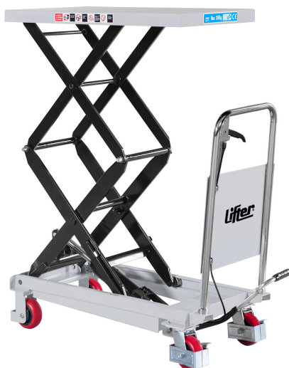
TAVOLA ELEVATRICE A DOPPIO PANTOGRAFO 350 kg