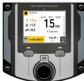
Fornito senza accessori, senza trainafile separato