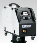
Trainafile separato WF 35 075078