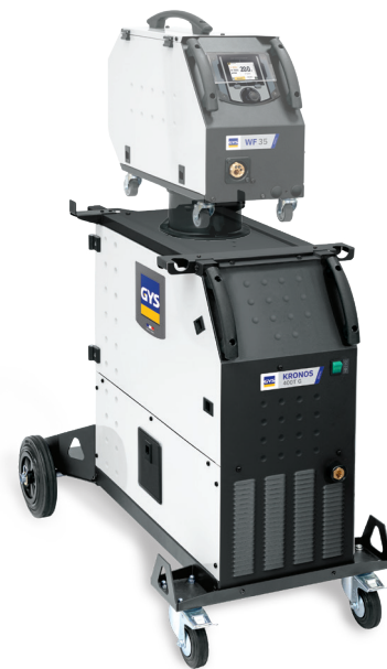
Fornito senza accessori, senza trainafile separato