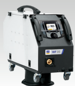
Trainafile separato WF 35 075078