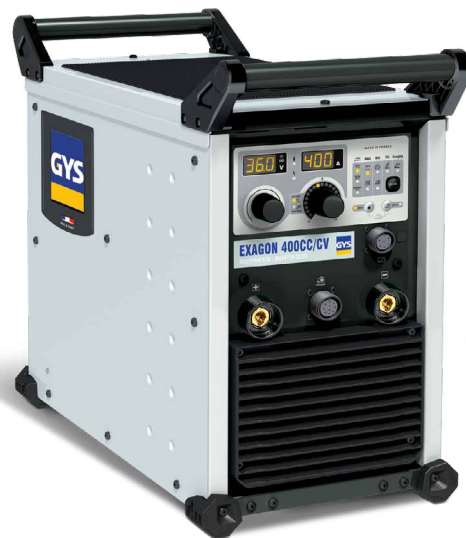
Fornito senza accessori