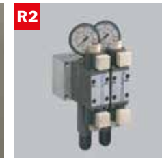
Reg. pressione morse doppio Adjustable vice pressure