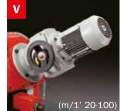
Motovariatore Blade speed variator