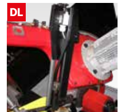
Dispositivo controllo deviazione lama Blade deflection control device