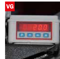
Visualizzatore gradi angolo di taglio Cutting angle display