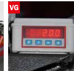
Visualizzatore gradi angolo di taglio Cutting angle display