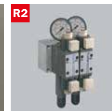
Reg. pressione morse doppio Adjustable vice pressure