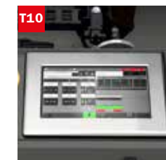
Touch screen 10" (solo per versione TOUCH) 10" touch screen (only for TOUCH mod.)