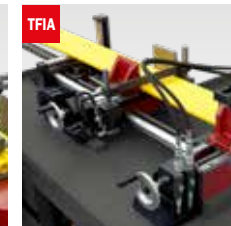
Taglio fascio oleodinamico Hydraulic bundle clamping device