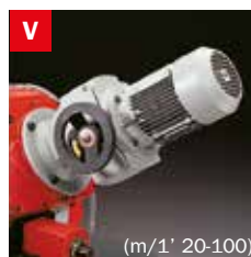
Motovariatore Blade speed variator