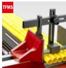
Taglio fascio meccanico Mechanical bundle clamping device