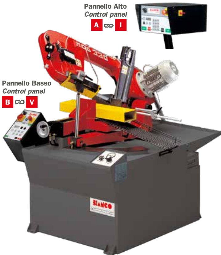
Pannello Alto Control panel