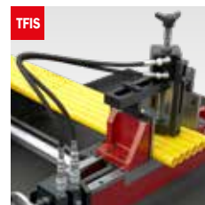
Taglio fascio oleodinamico Hydraulic bundle clamping device