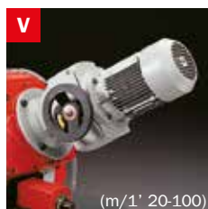
Motovariatore Blade speed variator