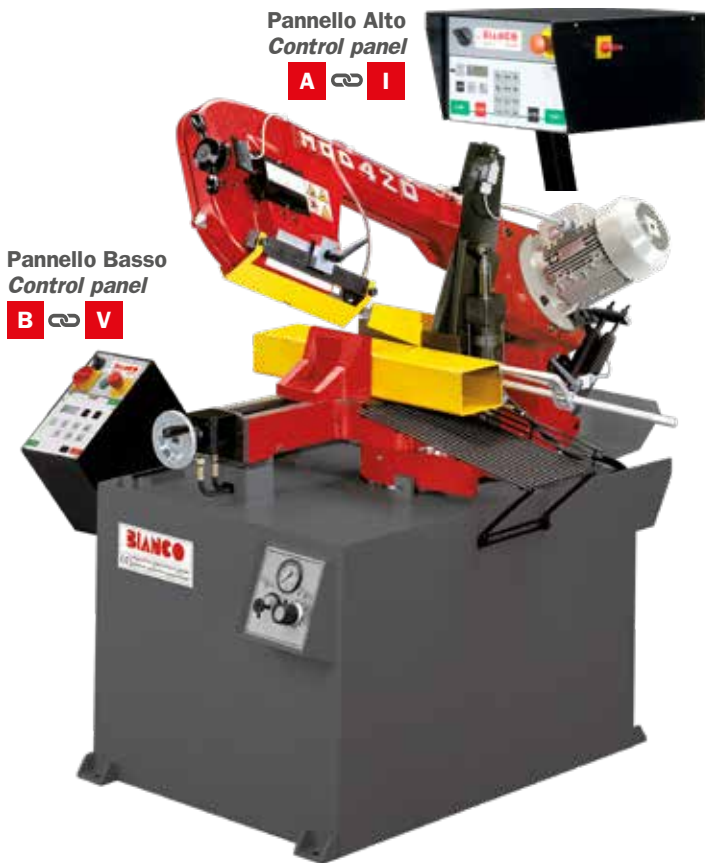
Pannello Alto Control panel