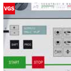
Visualizzatore gradi angolo di taglio Cutting angle display