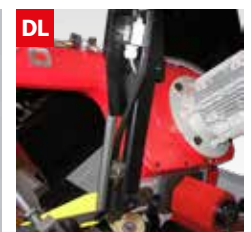
Dispositivo controllo deviazione lama Blade deflection control device