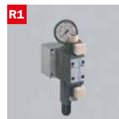
Reg. pressione morse Adjustable vice pressure