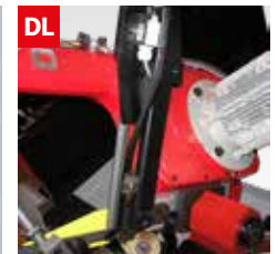
Dispositivo controllo deviazione lama Blade deflection control device