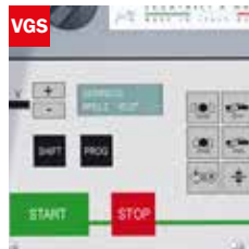
Visualizzatore gradi angolo di taglio Cutting angle display