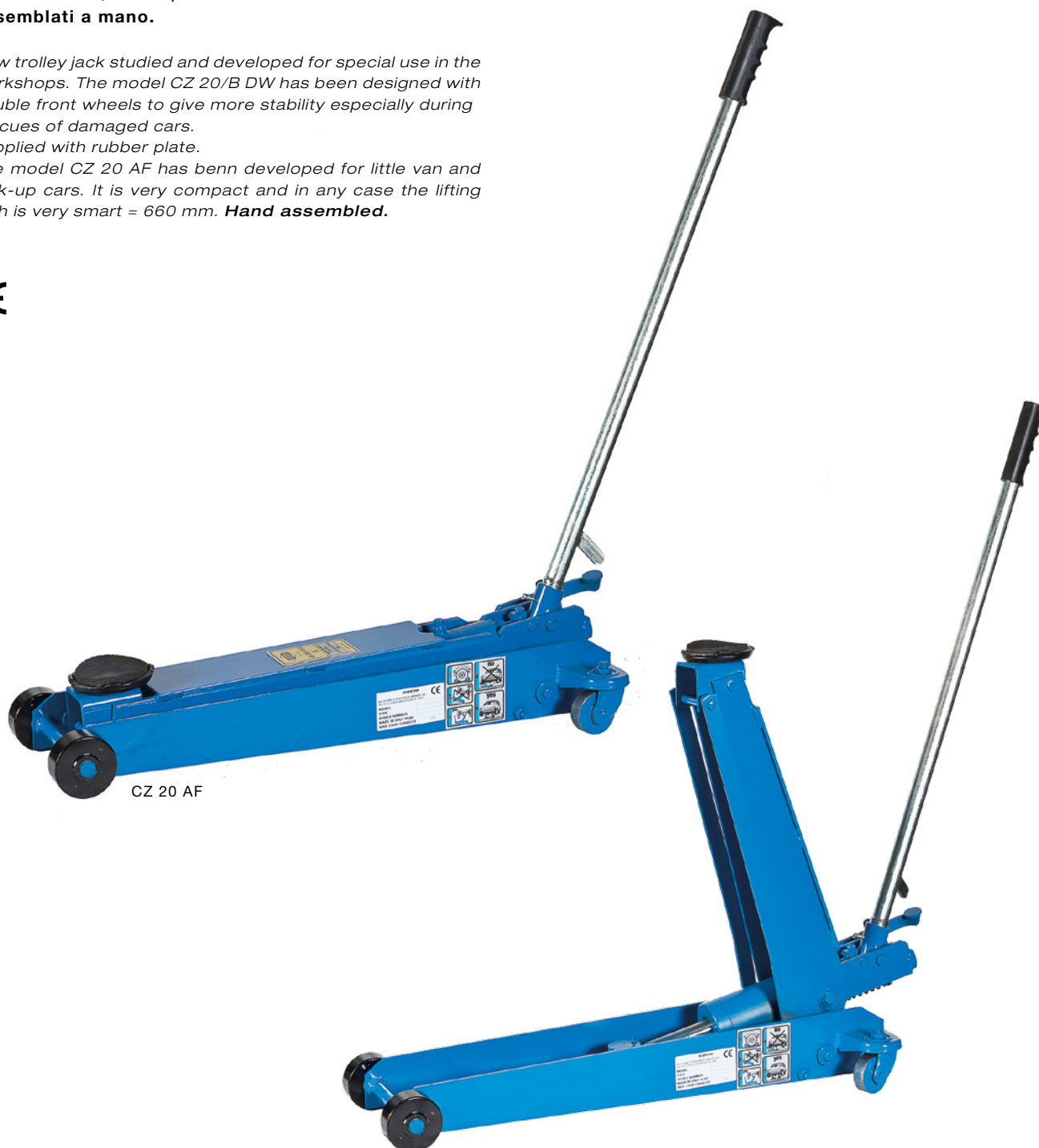
CZ 20 AF