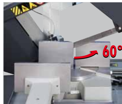
PH 262 - PH62HB